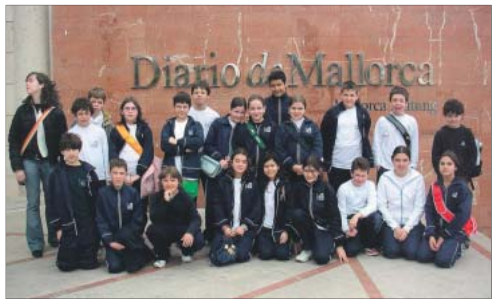
Col·legi Jesús Maria (Palma). 6è de primària.