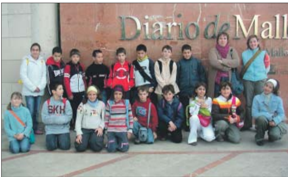
Col·legi Públic Port de Pollença. 5è de primària.