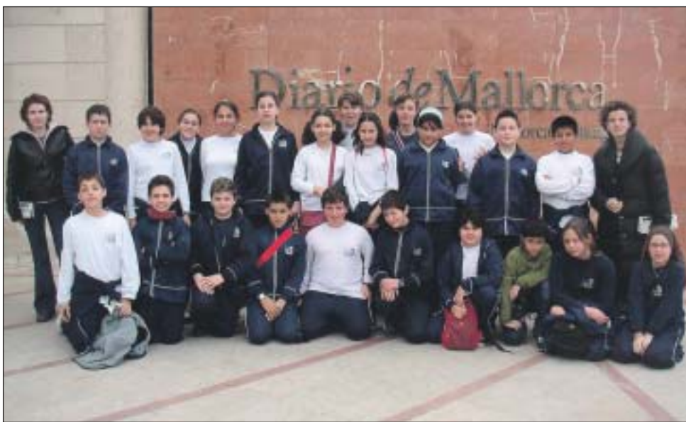
Col·legi Jesús Maria (Palma). 6è de primària.