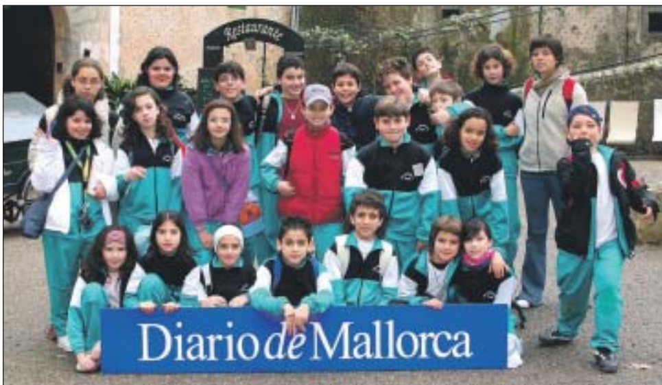
Col·legi Manjon de Palma. (5è de primària).