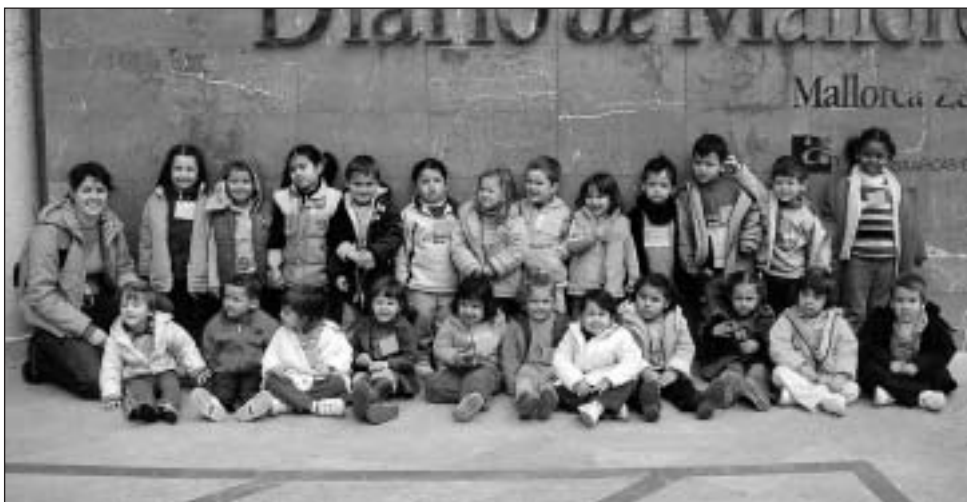
Educació Infantil del col·legi públic Coll d'en Rabassa (Palma).