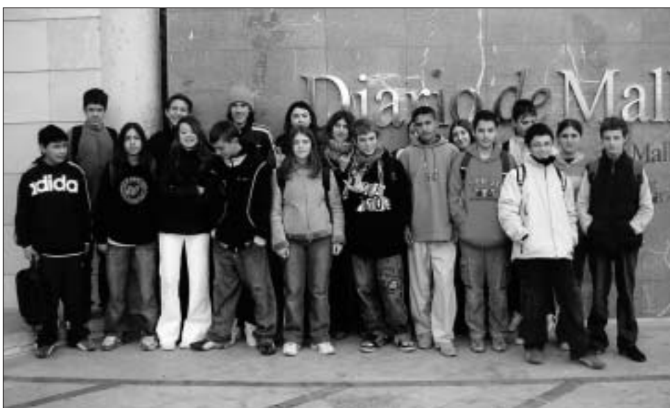
IES Porreres. 2n d'ESO.