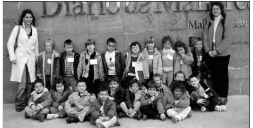
Educació Infantil del col·legi públic Coll d'en Rabassa (Palma).