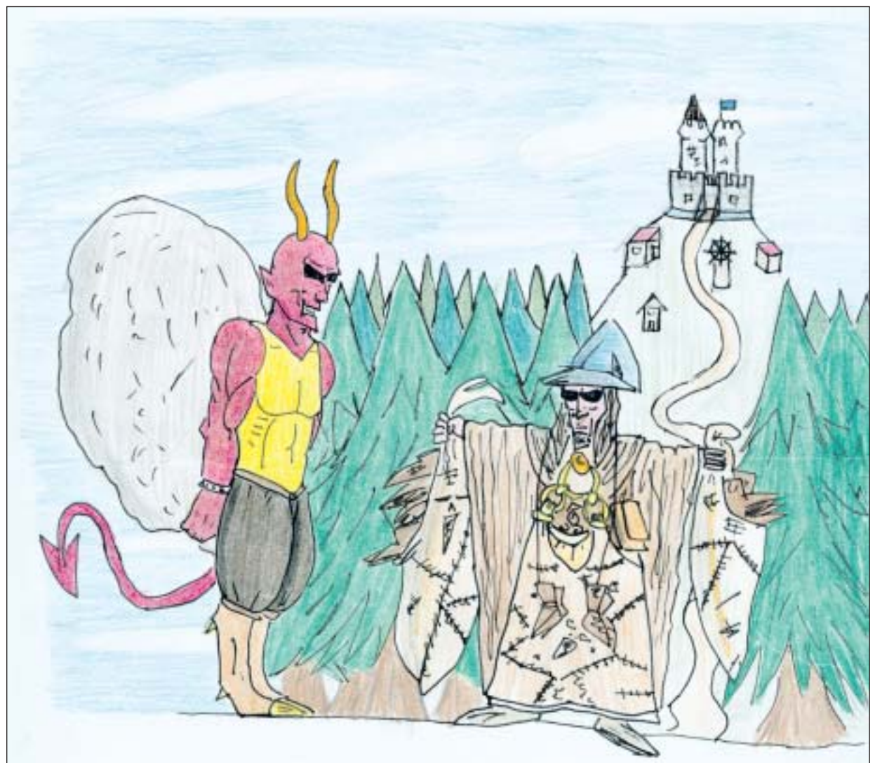
IL·LUSTRACIÓ: PERE ANTONI MASCARÓ (IES FELANITX)