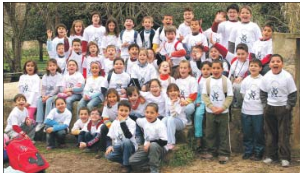
Tots els alumnes de 2n cicle del col·legi públic Inspector Joan Capó de Felanitx.