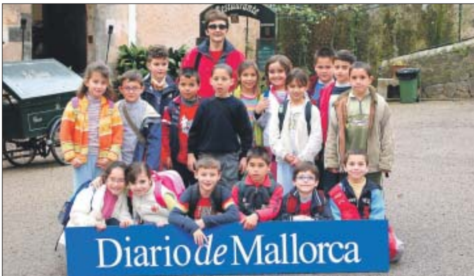
Col·legi Públic Inspector Joan Capó de Felanitx (2n C de primària).