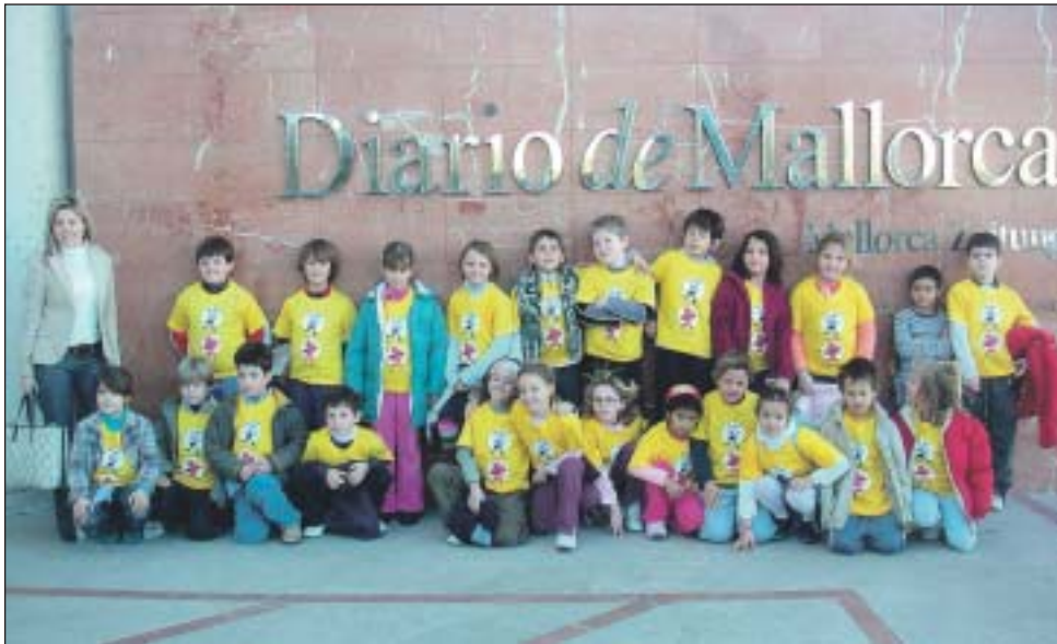
Col·legi Públic Migjorn (Palma). 2n de primària.