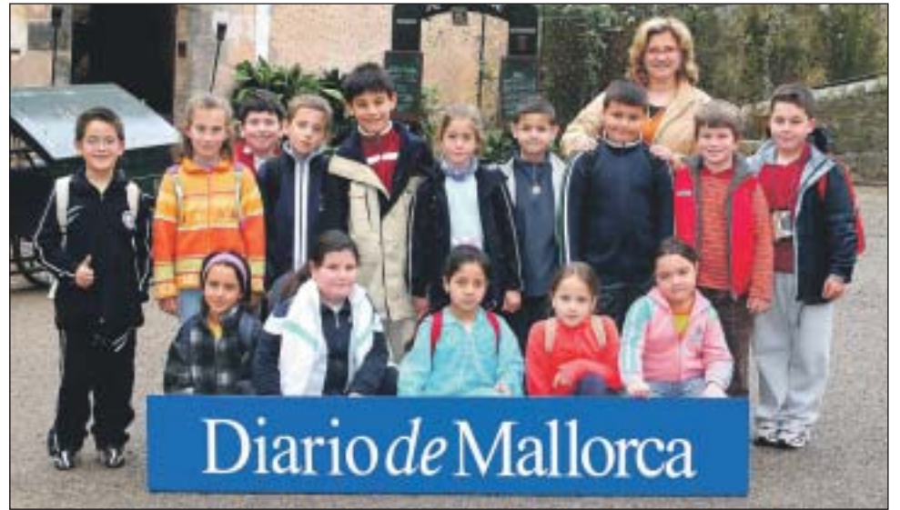
Col·legi Públic Inspector Joan Capó de Felanitx (2n B de primària).