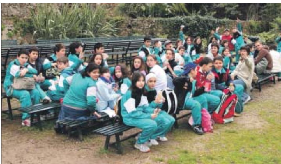
Tots els alumnes de 5è i 6è del col·legi Manjon de Palma berenant a La Granja.