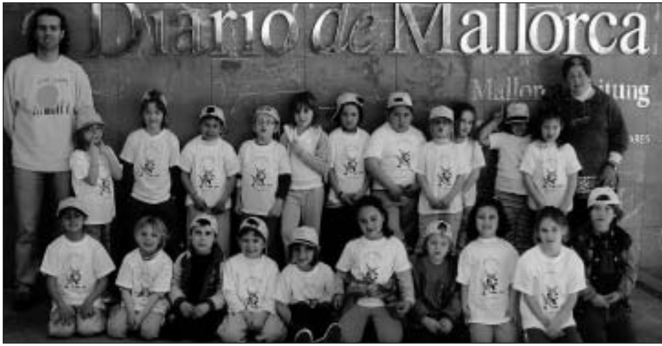
Col·legi Públic Sant Salvador (Artà).