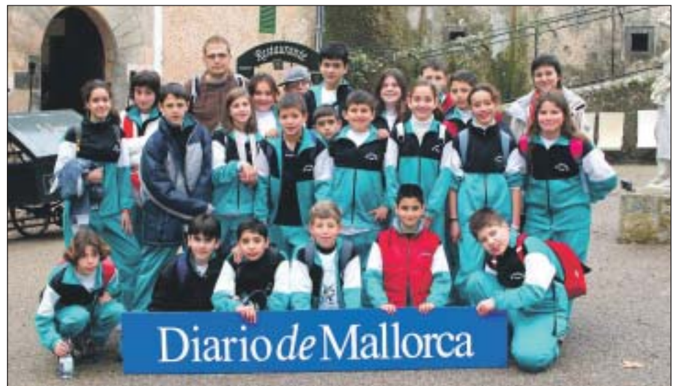
Col·legi Manjon de Palma. (6è de primària).