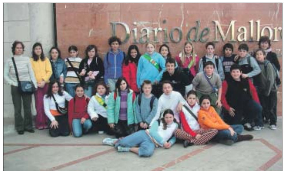
Col·legi Públic Port de Pollença. 6è de primària.