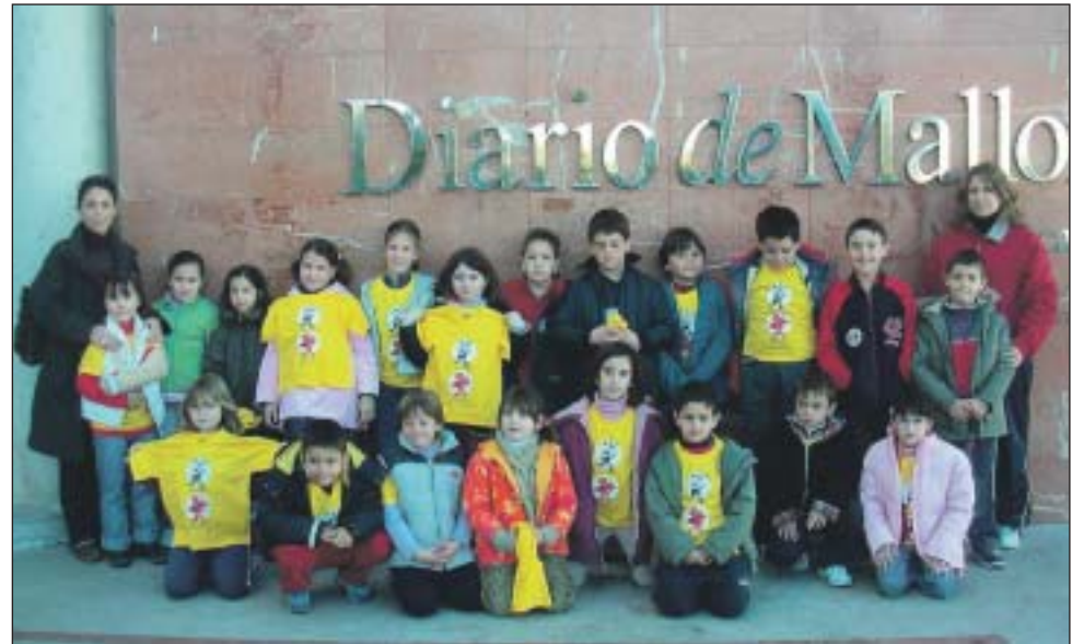
Col·legi Públic Migjorn (Palma). 2n de primària.