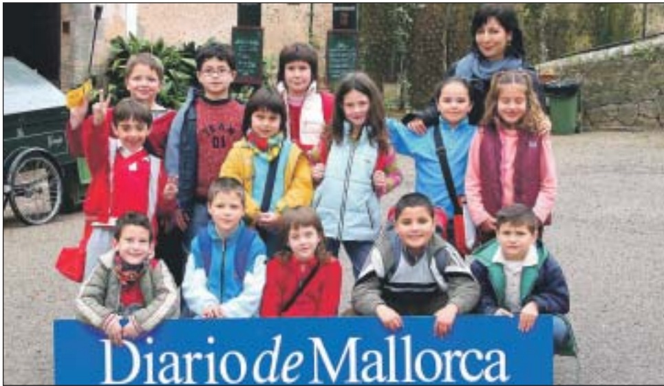
Col·legi Públic Inspector Joan Capó de Felanitx (2n A de primària).