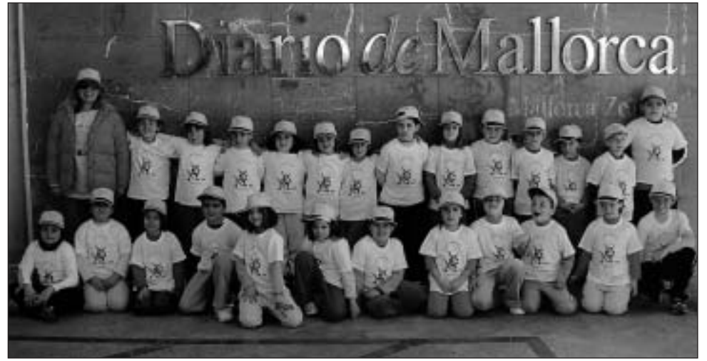
Col·legi Públic Sant Salvador (Artà).