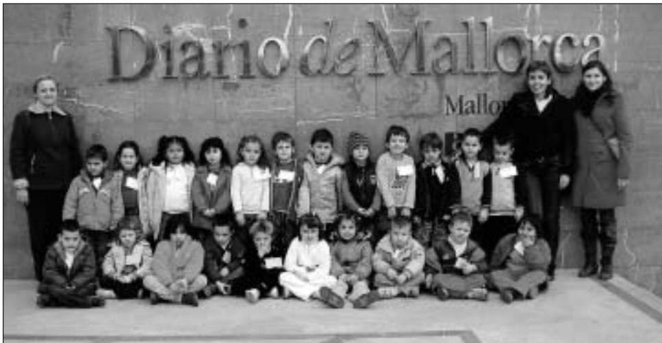
Educació Infantil del col·legi públic Coll d'en Rabassa (Palma).