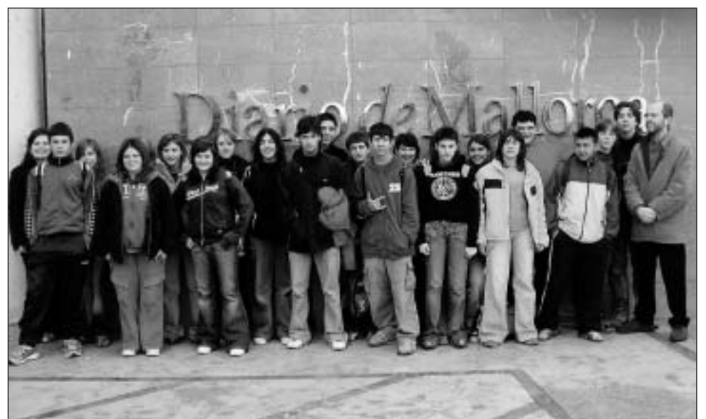
IES Porreres. 3r d'ESO.