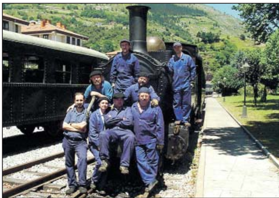
Esta foto, titulada 'Guardianes del tiempo', logró un premio de fotografía ferroviaria.

ferroviario Carlos Olmo Ribas. Propulsora de lo que han denominado "cultura ferroviaria", la AAFB también es la organizadora de las Jornades Ferroviaries a Balears , en las cuales participan anualmente y de forma muy activa los grupos ciudadanos y el propio Ayuntamiento de Palma, y en donde el tren y sus estaciones pueden ser objetos de reforma o de debate. Su experiencia en exposiciones ferroviarias ha recorrido diferentes pueblos de la isla para promocionar al ferrocarril (Petra, Inca, Son Servera, Manacor, Artà...). Miembro de la FAFIBA (Federació d'Associacions Fotogràfiques de les Illes Balears), la entidad ha organizado la I Jornada de Fotografia Ferroviaria , habiendo