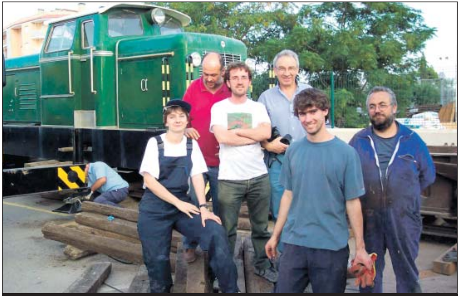
Parte del grupo de restauración de la Associació d'Amics del Ferrocarril de Balears.

Aunque el local social de la asociación se encuentra en Palma, la AAFB dispone de delegaciones comarcales en Sóller y en el Llevant mallorquín, en concreto en Manacor. “En un futuro esperamos poder am-