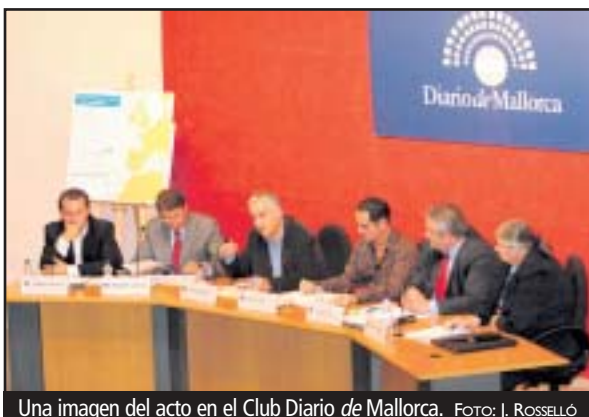
Una imagen del acto en el Club Diario de Mallorca.

Tras un año de investigación, los agentes del Equipo de Delincuencia Organizada y Antidroga (EDO) de la Guardia Civil, acompañados por inspectores de la Agencia Tributaria, han destapado en Mallorca una red dirigida por una familia que, a través de un complejo entramado de empresas del sector de la automoción y la náutica, habría llevado a cabo un fraude masivo, en especial con devoluciones indebidas del Impuesto sobre el Valor Añadido (IVA). Hasta el jueves habían sido detenidas cuatro personas en Mallorca e Italia, aunque la frenética actividad de los investigadores apuntaba a que la cifra de arrestos final será superior. Los agentes del EDOA comenzaron hace más de un año esta investigación.