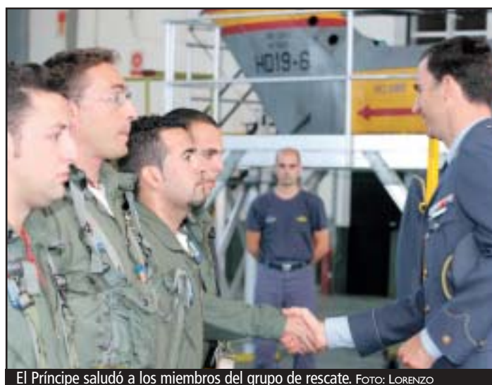
El Príncipe saludó a los miembros del grupo de rescate.

La patrullera HJ-V, del Servicio de Vigilancia Aduanera, interceptó el martes en aguas de Formentera un pesquero con bandera británica que transportaba unos 3.740 kilos de hachís, lo que constituye el mayor alijo de esta droga intervenido en Balears en los últimos años. El barco Quiet Waters , un antiguo bacaladero, había sido modificado por una organización de narcotraficantes y acondicionado para el transporte de droga. Junto a los 120 fardos de hachís, transportaba dos lanchas con potentes motores fuera borda.