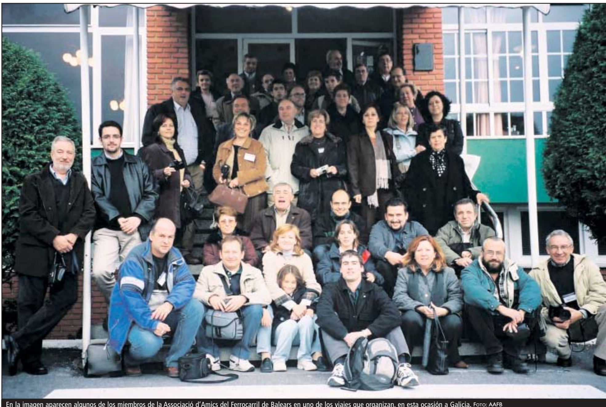
En la imagen aparecen algunos de los miembros de la Associació d'Amics del Ferrocarril de Balears en uno de los viajes que organizan, en esta ocasión a Galicia.