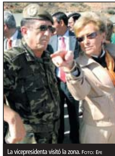
La vicepresidenta visitó la zona.

Las fuentes marroquíes añadieron que algunos de los inmigrantes subsaharianos murieron por disparos de bala y otros