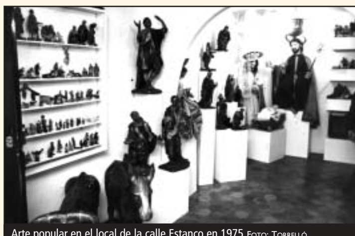
Arte popular en el local de la calle Estanco en 1975

Llabrés, a través de "Bruixerries", supo destacar el componente popular, imaginativo y tradicional, de muchos objetos. Y en cierto modo marcó el punto de inflexión a partir del cual lo popular mallorquín dejó de considerarse "pueblerino" o "anticua-