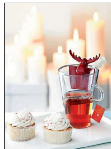
Diferentes propuestas de decoración para vestir con diseño nuestros hogares. LA OCA