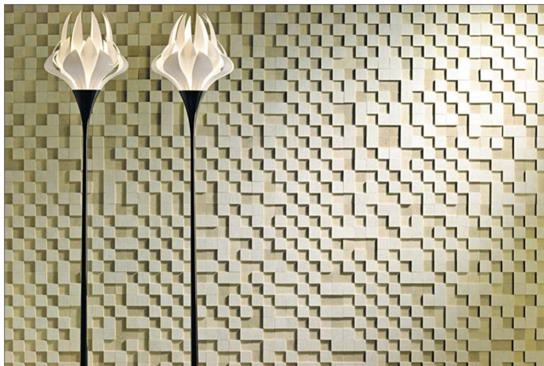
Vista de uno de los productos que ofrece la firma. APAVISA