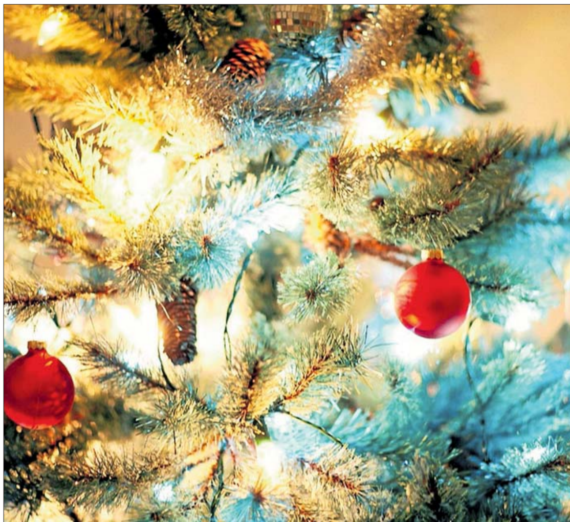
La iluminación LED es cada vez más utilizada en la decoración navideña.