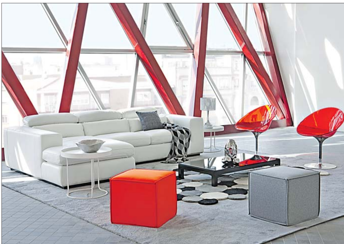
La Oca combina la calidad de sus muebles con diseños contemporáneos. LA OCA

sos, vajillas, pequeños electrodomésticos, champañeras, cubiteras, picadoras de hielo para cóctel y multitud de accesorios de cocina. La buena mesa debe ir acompañada de la mejor presentación y, para ello, La Oca dispone de una amplia gama de complementos de decoración, artículos de regalo como huchas, cajas decoradas, velas, marcos de fotos y centros de mesa. También destaca el diseño de los productos de silicona, con las máximas garantías de Platinum 100% alimentaria, resistentes a las altas temperaturas, antiadherentes, de fácil limpieza en lavavajillas y útiles para cocinar al vapor o repostería, en hornos y microondas.