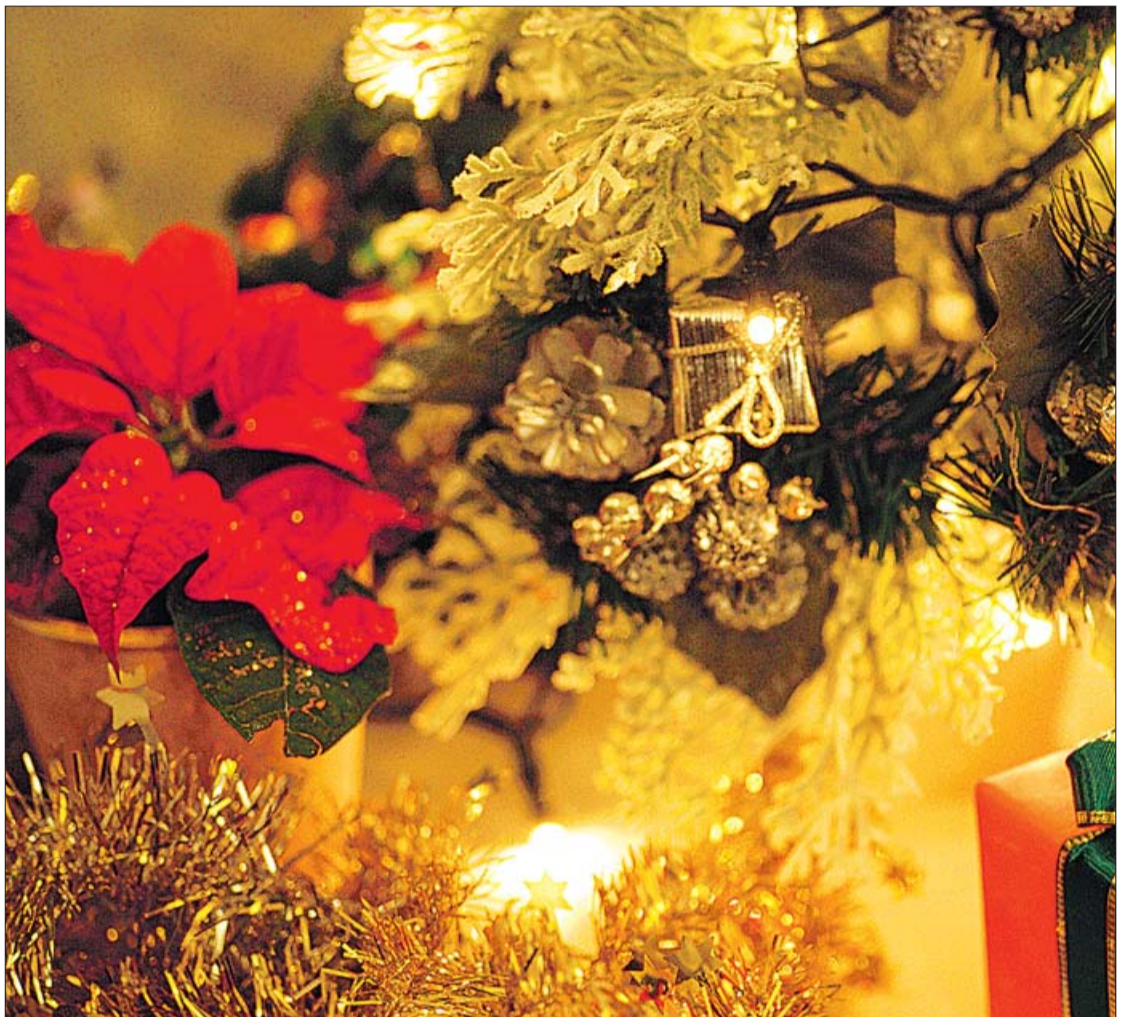
La poinsettia se ha convertido en un elemento decorativo más para estas fiestas.

Las flores de Pascua son el símbolo de la Navidad, una planta de calidad y bien cuidada le llenará su hogar de alegría y color por mucho tiempo.