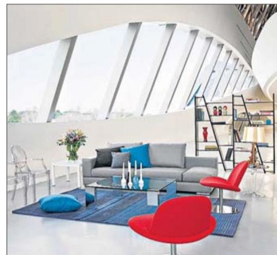
Atractivos colores y agradables texturas. LA OCA