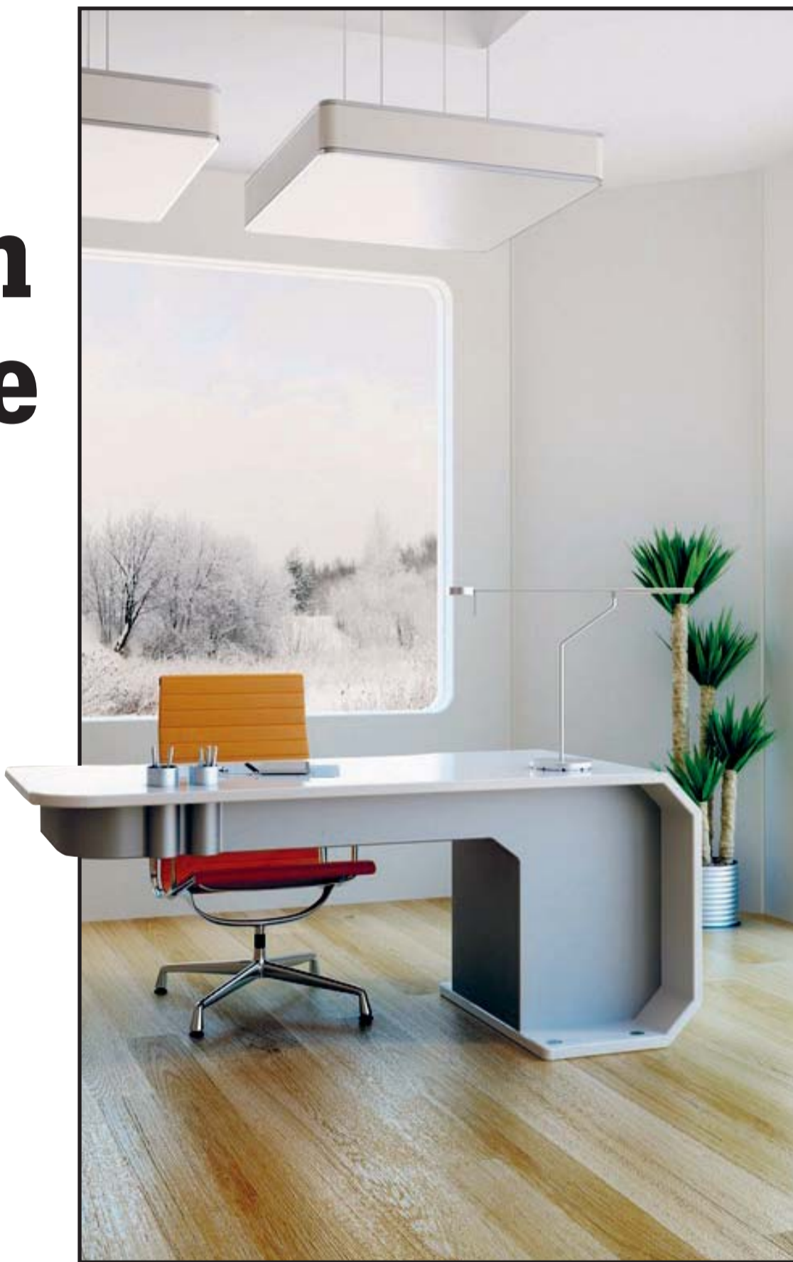
Predomina el color blanco para dar mayor sensación de amplitud.

Los tejidos empleados provienen de la naturaleza y geografía de los países nórdicos, como son el algodón y el lino. Las alfombras más utilizadas son las de lana por las temperaturas tan bajas de estos lugares.