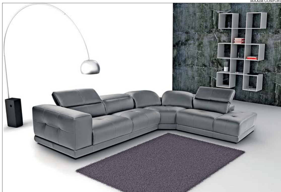
Màxim dispone de gran variedad de estilos, diseños y acabados.