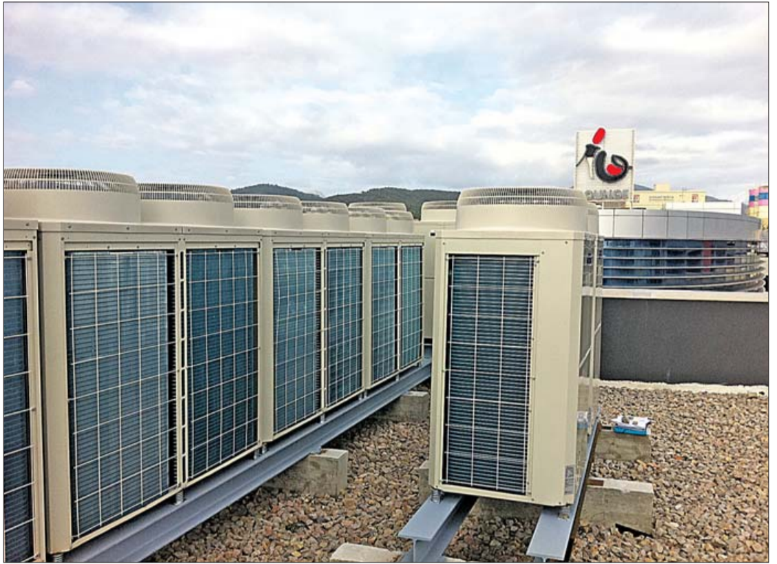
Climaes apuesta por las innovaciones tecnológicas para ofrecer las mejores soluciones. CLIMAES

Entre las obras más emblemáticas acometidas por el equipo de Climaes en este último año cabe destacar la climatización de un hotel en el centro de Palma de 47 habitaciones mediante una instalación VRV de conductos, para climatizar todas las zonas nobles, y el aprovechamiento de la instalación existente mediante enfriadora de agua, para alimentar los equipos de aire acondicionado de las nuevas habitaciones.