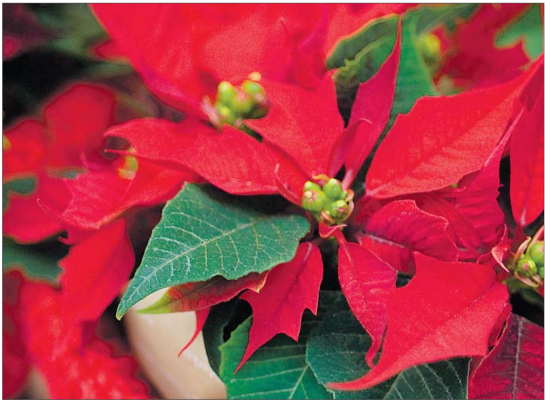
La poinsettia roja es la más característica aquí, aunque existe en diversos colores.