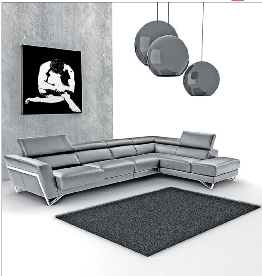
La calidad de las pieles marca la diferencia de los sofás de Màxim Confort. MÀXIM CONFORT

En definitiva, le acercan el confort a su hogar. Así, si tiene que cambiar su viejo sofá o adquirir uno nuevo, en cualquiera de las tres tiendas con las que cuenta Màxim Con-