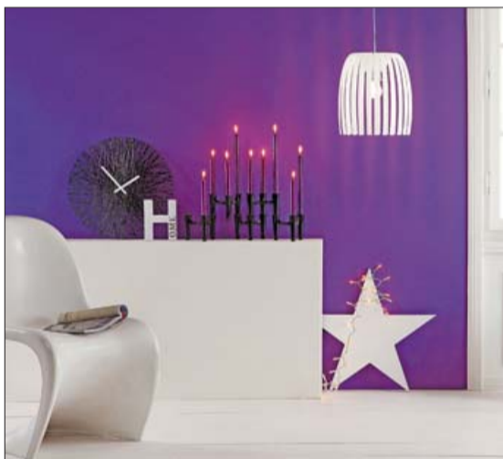
Decoración vanguardista y actual. LA OCA