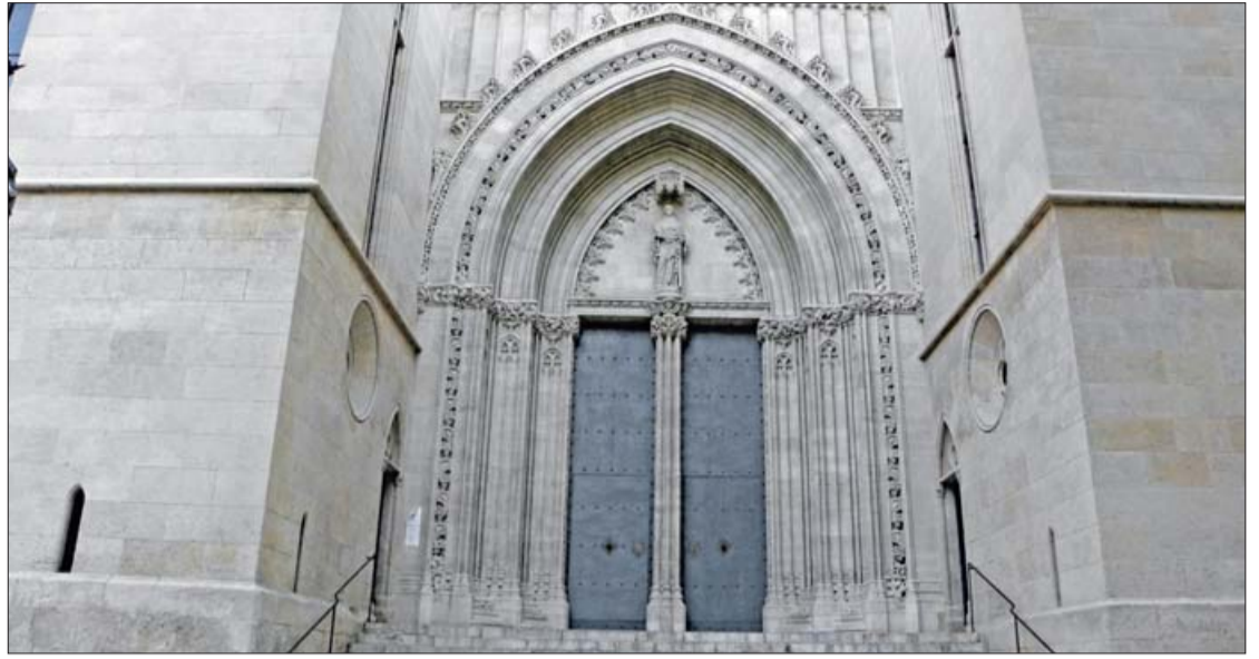
Cada rehabilitación requiere un estudio muy detallado y maquinaria de alta tecnología. REFOART

Según su experiencia, los trabajos más complejos son aquellos monumentos que han sufrido graves alteraciones físicas durante su historia, ya que a la hora de su restauración es necesario tener mucha prudencia y un gran conocimiento del bien con el fin de no crear 'falsos históricos'. También son complejos los trabajos que requieren aquellos elementos arquitectónicos que han sufrido los efectos de la contaminación creando una costra de suciedad excesivamente dura, cuya eliminación representa un trabajo arduo, mano de obra muy especializada y requiere alta tecnología en maquinaria. Para cualquier tipo de proyecto, Refoart dispone de la tecnología adecuada como es el caso del láser y el escaneado en tres dimensiones, y con el asesoramiento de historiadores, técnicos diplomados en restauración, arquitectos técnicos, y lo primordial, una plantilla muy preparada, implicada y consciente de lo que representa un monumento en nuestra sociedad.